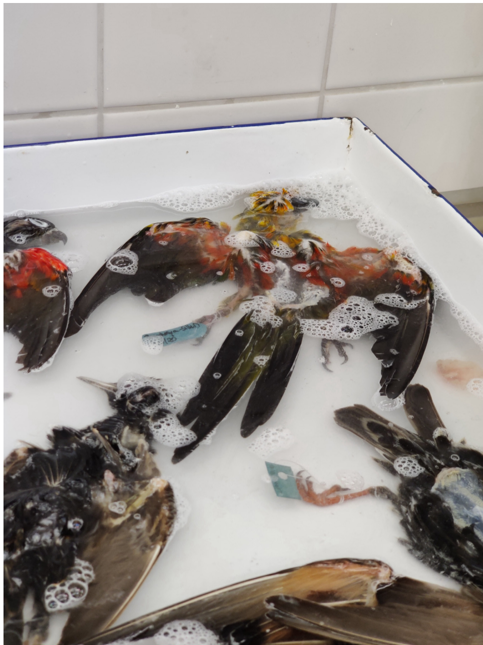
Beim Gerbprozess werden in einer Lauge die Poren aufgeweicht und anschließend Gerbstoff in der Haut fixiert.

Bei der Gerbung, die der langfristigen Konservierung von Tierhäuten mittels Gerbstoffen dient, wurde der Körper zunächst in einer Salz-Lösung mit Supralan geweicht. Der Gerbvorgang findet in mehreren Schritten statt und dient der Fixierung des Gerbstoffes in der Haut. Dieser Vorgang nimmt etwa einen Arbeitstag in Anspruch. Über Nacht wird die handtuchfeuchte Haut auf einem Gitter im Kühlschrank aufbewahrt, um am nächsten Tag die Gerbung mit dem Prozess der Neutralisation abzuschließen. Von der Gerbung wird stets ein eigenes Protokoll angefertigt.