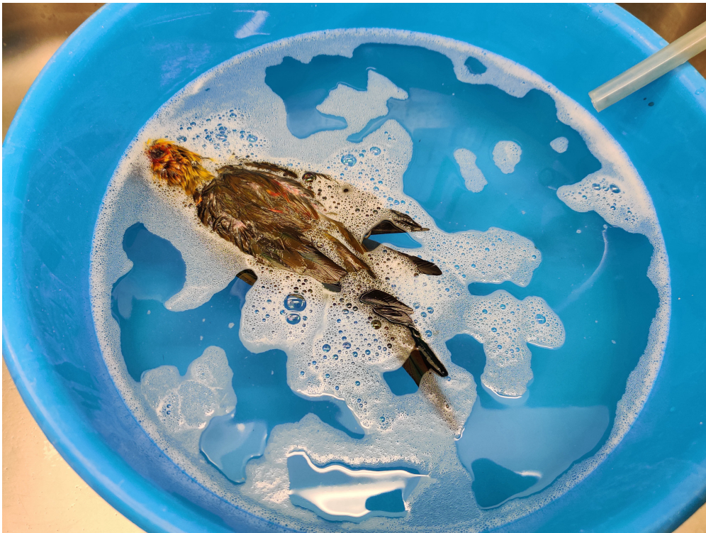
Wasserbad mit Supralan und Salz zur Reinigung der Haut und eventuell verschmutzter Federpartien.

Während die Fleischreste entsorgt und später außerhalb des Museums fachgerecht verbrannt wurden, wurde die Vogelhaut mit Wasser, Supralan und Shampoo mehrmals gewaschen und anschließend bis zum Gerbungstermin in einer Plastiktüte erneut im Gefrierschrank aufbewahrt. 7