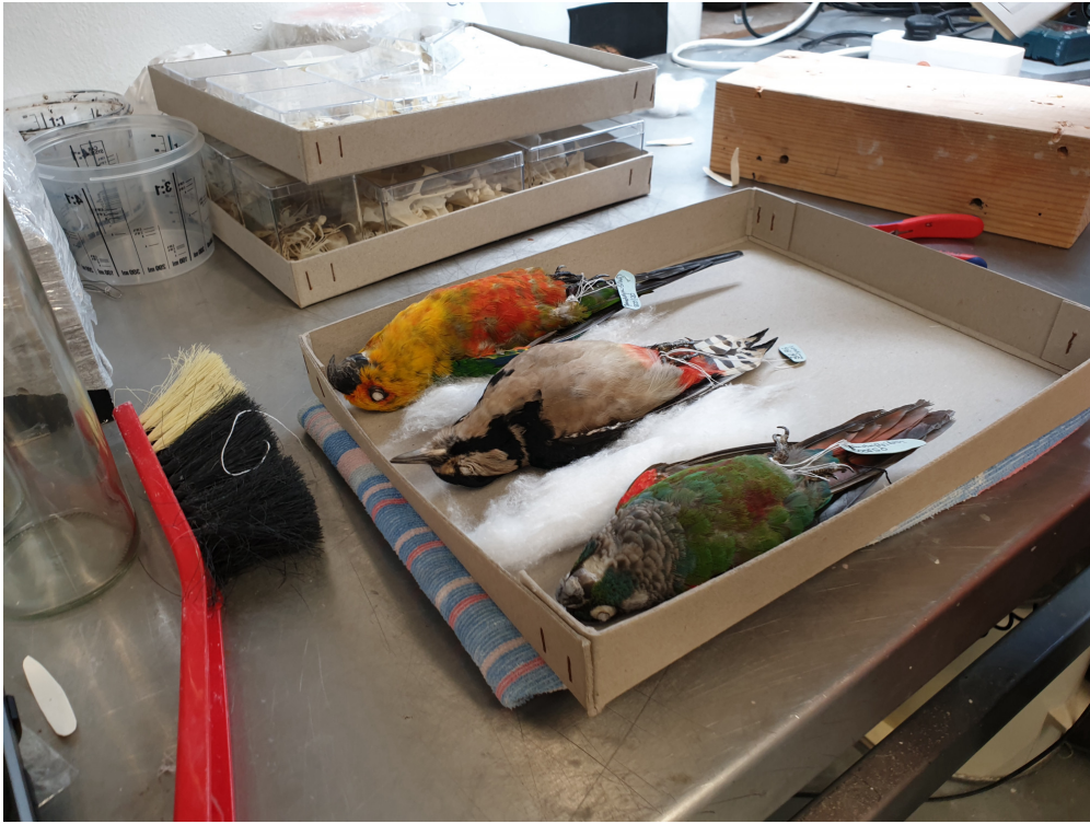
Vogelbälge auf dem Weg in die Sammlung

Dort übertrug der Sammlungspfleger Pascal Eckhoff die Informationen des Datenblatts in die digitale Sammlungsdatenbank. 10 Aus dieser kann man auch ersehen, dass das Tier nicht das erste Exemplar von Aratinga jandaya in der Vogelsammlung des Museums ist. In den Jahren 1895 und 1923 erhielt die Sammlung bereits zwei Exemplare für die Balgsammlung. Außerdem befinden sich weitere Jendayasittiche in Alkohol und als Skelett in der Vogelsammlung.