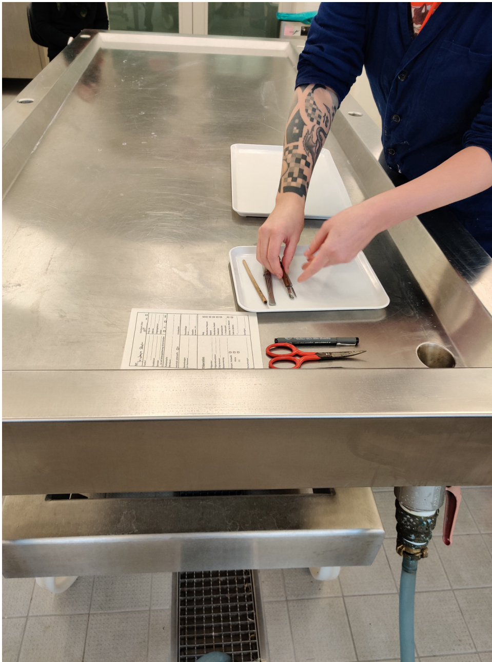
Datenblatt und Instrumente zur Vermessung, Hautgewinnung und Teilskelettbearbeitung