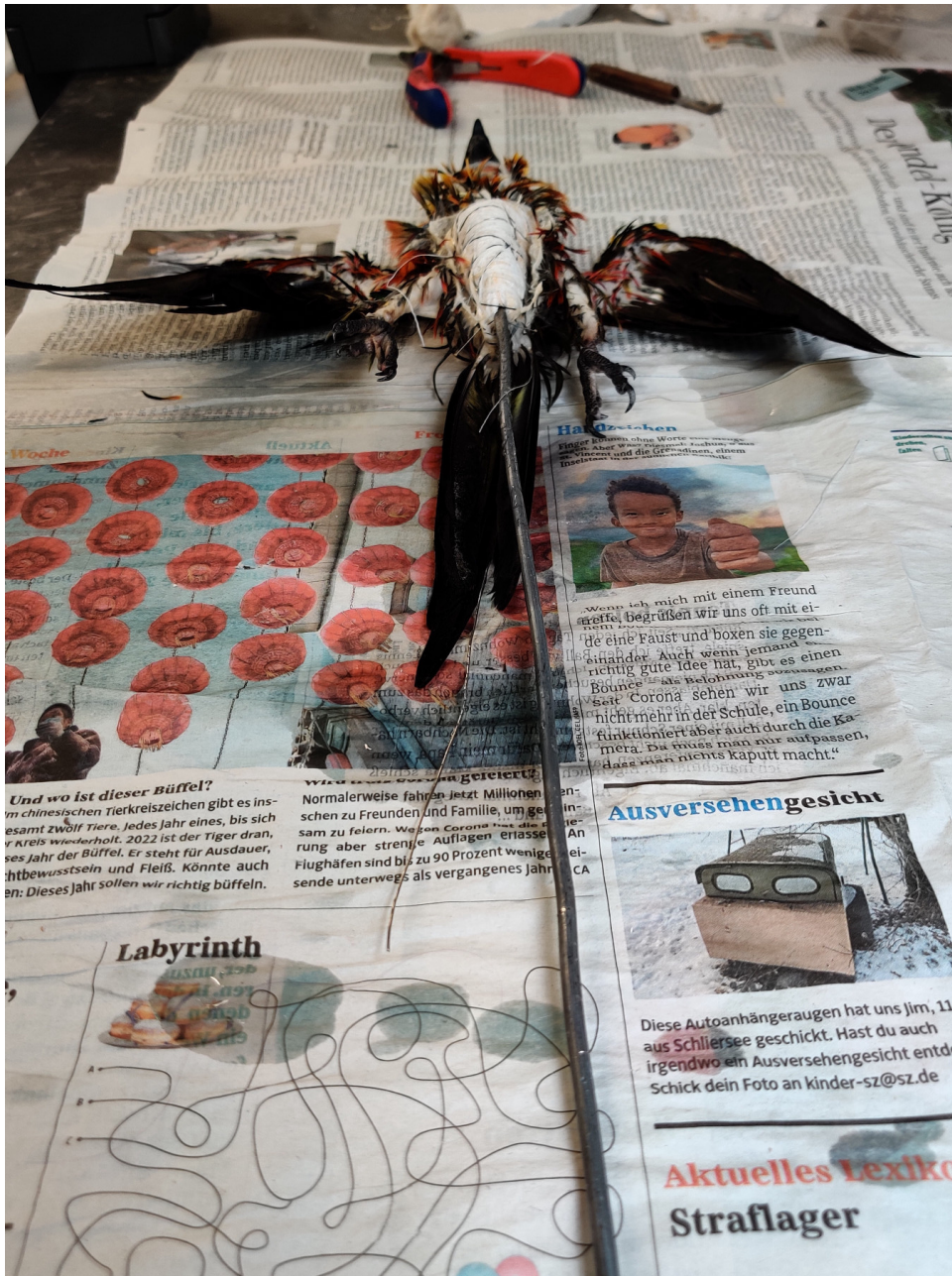
Nasser Vogelbald mit eingesetztem Holzwickkörper und Metallstab als Griff

Nach dem Trockenföhnen des Gefieders mussten die Federn in mehrstündiger Arbeit gelegt werden. Das bedeutet, das Gefieder zu ordnen, damit die Federpartien wie beim lebenden Vogel liegen.