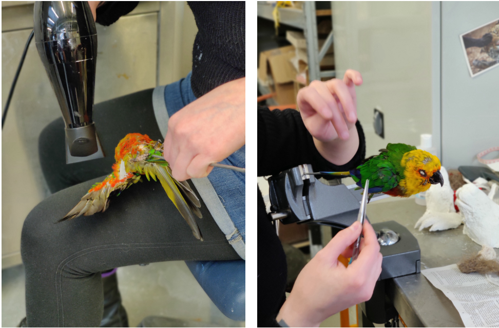
Trockenföhnen und Federn legen

Für die Herstellung des Teilskeletts musste nun auch der originale Vogelkörper vollständig 'entfleischt' werden, der im Gegensatz zum Schädelknochen nicht wieder in den Balg eingeführt wird. Der vom Fleisch befreite Vogelkörper wurde anschließend zum sogenannten Entbluten in eine Salzlösung gelegt. Aufgrund der geringen Größe des Vogelkörpers entschied sich die Präparatorin für eine Knochenpräparation mit Hilfe von Speckkäfern. Hierbei werden die Skeletteile für mehrere Tage in einen Behälter mit Speckkäfern in einem erwärmten Schrank gelegt. 9 Diese aasfressenden Insekten lassen kein Fleisch an den Knochen übrig.