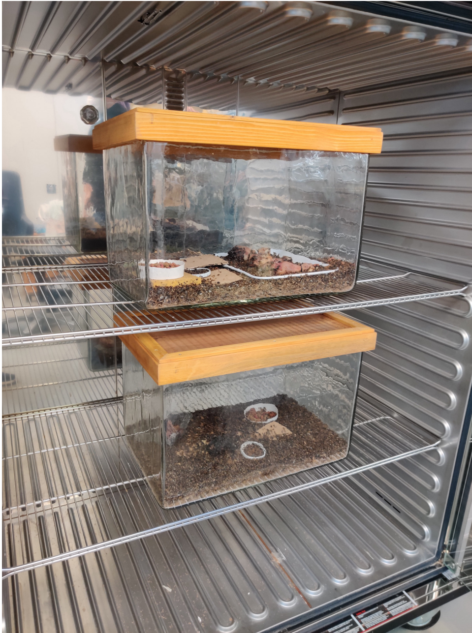
Herstellung des Teilskelettes mithilfe von Speckkäfern in einem Wärmeschrank