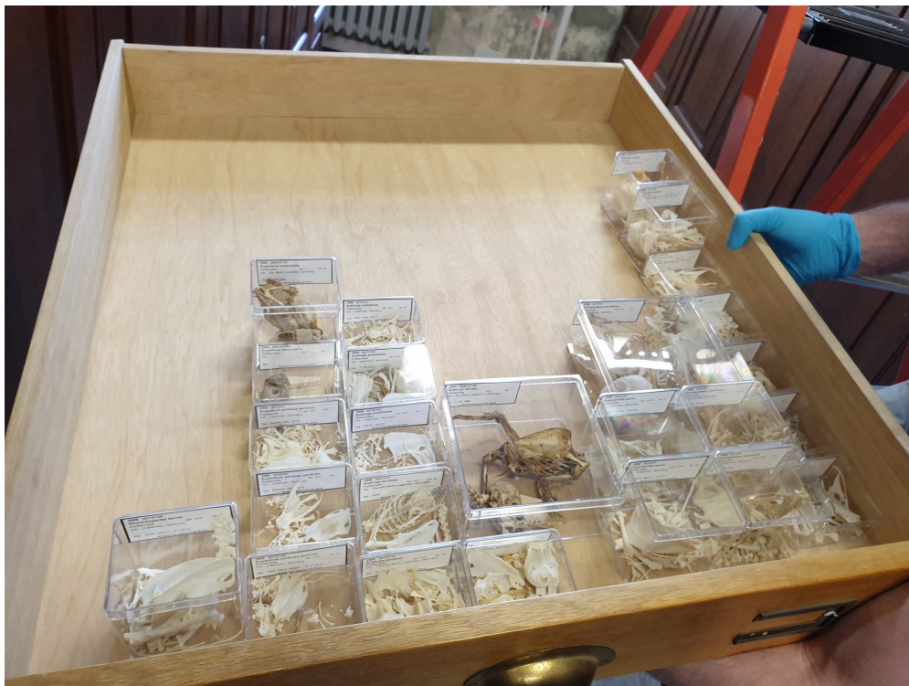
Einordnen des Teilskeletts in die Sammlung

Am Ende ist dieser Vogel unter der Inventarnummer 'ZMB 2021.171' in der Sammlungsdatenbank erfasst worden, während Balg und Teilskelett in einer Schublade in der wissenschaftlichen Sammlung eingeordnet worden sind und damit offiziell zu den Objekten des Museums Naturkunde Berlin gehören.