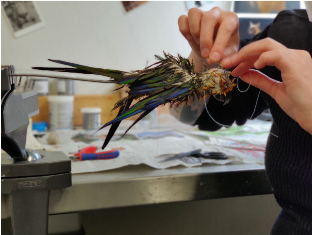
Nach der Gerbung und dem Einsetzen des Holzwollkörpers wird die Haut zusammengenäht.

Eine Metallstange, die unten in den Holzwollkörper gesteckt wurde, diente als Griff, um den Balg während des Arbeitsprozesses leichter halten und bearbeiten zu können. Er erleichterte insbesondere das Nähen und schonte das Gefieder.