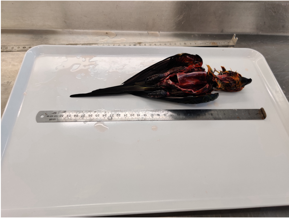
Vermessung des Vogelkörpers

Für jedes Tier wird ein solches Datenblatt angelegt, auf dem Materialien, Techniken, die bekannten Informationen über den Vogel und das Datum der Präparation eingetragen werden.