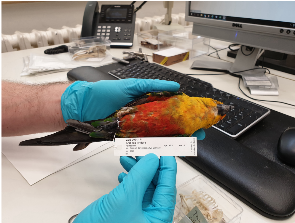
Etikett zur Identifizierung des Balgs

Am Ende ist dieser Vogel unter der Inventarnummer 'ZMB 2021.171' in der Sammlungsdatenbank erfasst worden, während Balg und Teilskelett in einer Schublade in der wissenschaftlichen Sammlung eingeordnet worden sind und damit offiziell zu den Objekten des Museums Naturkunde Berlin gehören.